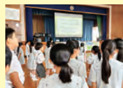
オープンスクール