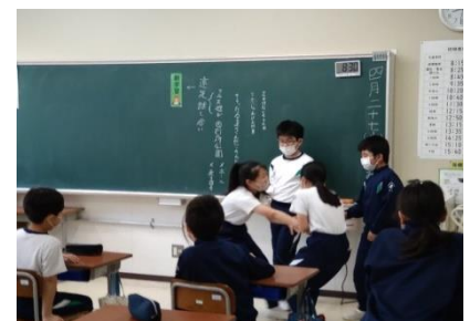
はないちもんめ引っ張り合い Ver.

学校での生活をよりよくするための話し合いと、そこで行われる合意形成は、特別活動で育成する重要な資質・能力の1つです。特別活動では、楽しい活動までの間に、児童会や、縦割り班、学級、クラブなどで、このようなことを繰り返し行っています。