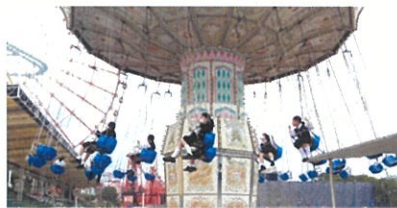
時間いっぱい楽しめます！

オープンの9時半から、昼食をはさみ、14時半まで、おなかいっぱい楽しんだ子どもたち。