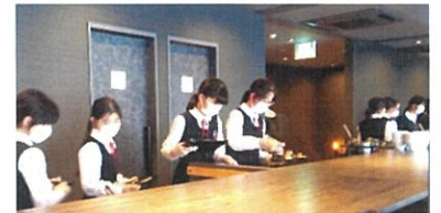
バイキングでの食事です！

見学後、一日目の宿泊場所「i+Land Nagasaki (アイランド長崎)」に移動です。