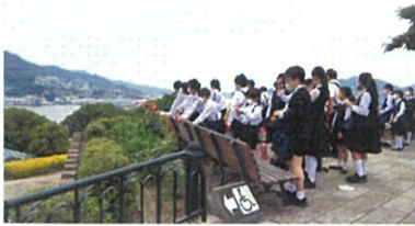
グラバー園より臨む

「大浦天主堂」・「グラバー園」見学の後、子どもたちが楽しみにしていた「買い物タイム」です。値段をしっかりと確認しながら買い物を楽しみました。