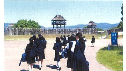
吉野ヶ里は晴天でした！

朝8時にバス2台で学校を出発。大分道の山田SAで休憩を取った後、まず向かったのは佐賀県の「吉野ヶ里歴史公園」です。雲一つない晴天でしたが、ぐんぐん気温が上昇した中での見学でした。「勾玉(まがたま)づくり体験」を行い、自分だけの「勾玉」を身につけた子どもたち