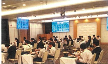
個別の食事が用意されました