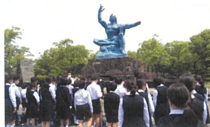
折鶴を捧げ、平和集会を行いました