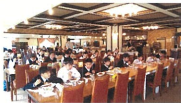
昼食後活動再開です！