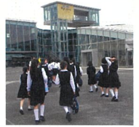
「がまだすドーム」へ

二日目最後の見学地は、島原市の「雲仙岳災害記念館（がまだすドーム）」です。普賢岳の災害を自分のものとして感じられる工夫が幾所にもありました。